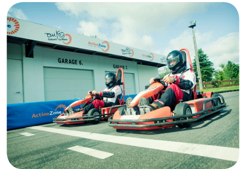
Hvem kører længst på 1/2 liter brændstof?